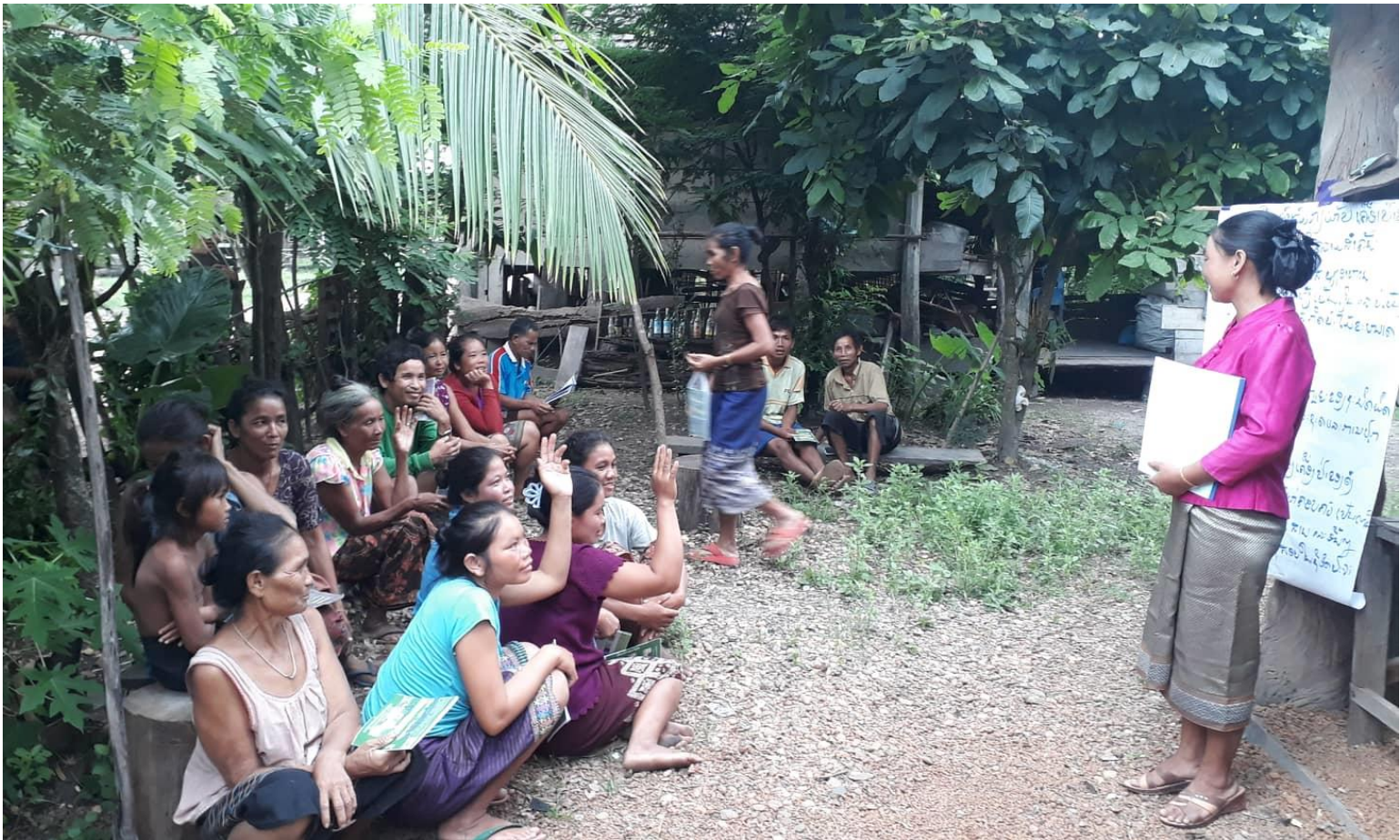
ສະມາຊິກຂອງກຸ່ມຫຼັກຢູ່ໃນໂຄງການສົ່ງເສີມກຸ່ມຊາວກະສິກອນປົກສາຫາລືກັນກ່ຽວກັບວິທີການປັບປຸງໂພສະນາການຢູ່ໃນຄອບຄົວຂອງເຂົາເຈົ້າ

ພວກເຮົາເຮັດວຽກຮ່ວມກັບຄົນທຸກຍາກ ແລະ ຮວມພະລັງນຳເຂົາເຈົ້າ.