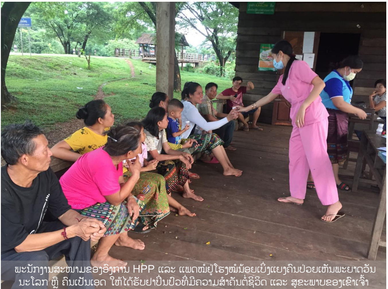
ພະນັກງານສະໜາມຂອງອົງການ HPP ແລະ ແພດໝໍຢູ່ໂຮງໝໍນ້ອຍເບິ່ງແຍງຄົນປ່ວຍເຫັນພະຍາດວັນນະໂລກ ຫຼື ຄົນເປັນເອດ ໃຫ້ໄດ້ຮັບຢາປິ່ນປົວທີ່ມີຄວາມສໍາຄັນຕໍ່ຊີວິດ ແລະ ສຸຂະພາບຂອງເຂົາເຈົ້າ

ດ້ວຍໂຄງການສາທາຂອງພວກເຮົາ ພວກເຮົາຕອບສະໜອງຕໍ່ວິທີການດໍາລົງຊີວິດຂອງປະຊາຊົນແນວໃດ; ພວກເຮົາເຮັດວຽກຮ່ວມກັບເຂົາເຈົ້າເພື່ອສ້າງ ແລະ ຮັກສາສຸຂະພາບທີ່ດີຢູ່ໃນຊຸມຊົນຂອງຕົນ ແລະ ຍົກລະດັບການຢູ່ດີກິນດີສໍາລັບທຸກຄົນທັງໝົດ.