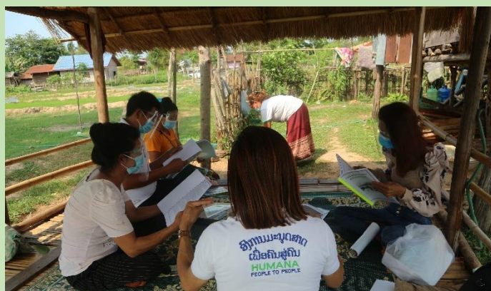
ພວກເຮົາຈັດຕັ້ງກຸ່ມຕິດຕາມຜູ້ປ່ວຍໂລກເອດໂດຍມີຄົນໃກ້ສິດໃນຄອບຄົວ, ໜູ່ເພື່ອນ ແລະ ຜູ້ປ່ວຍເອງ