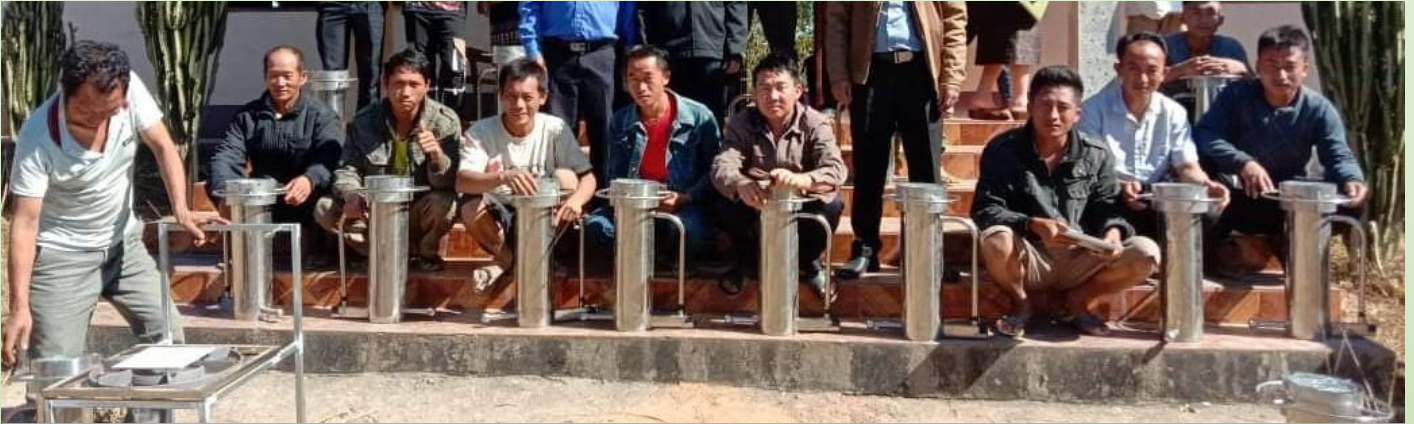
ຈຳນວນ 300 ຄອບຄົວຢູ່ບ້ານຜາເມືອງ ແລະ ບ້ານຜາໃດໄດ້ນຳໃຊ້ເຕົາປະຢັດຊີວະມວນແທນການໃຊ້ໄມ້ພືນ ໃນຄົວເຮືອນ. ຜົນດີຕໍ່ສຸຂະພາບຈາກການທີ່ບໍ່ມີຂວັນໄຟຢູ່ໃນເຮືອນຄົວ ແມ່ນສຳຄັນຫຼາຍ.

ຄອບຄົວສ່ວນຫຼາຍຢູ່ໃນເຂດຊົນນະບົດເຮັດເຮືອນຄົວເພື່ອແຕ່ງກິນຢູ່ໃນເຮືອນ. ເຂົາເຈົ້ານຳໃຊ້ໄມ້ທີ່ຕັດມາຈາກປ່າເປັນເຊື້ອເພີງໃນການດັງໄຟ ຫຼື ນຳໃຊ້ຖ່ານທີ່ຜະລິດຢູ່ໃນທ້ອງຖິ່ນ. ການທີ່ເຮັດແບບນີ້ມີຄວາມສ່ຽງຫຼາຍຕໍ່ສຸຂະພາບ ໂດຍສະເພາະຜູ້ເປັນແມ່ ແລະ ເດັກນ້ອຍທີ່ໂດຍປົກກະຕິຈະຢູ່ໃນເຮືອນຄົວເປັນເວລາຫຼາຍຊົ່ວໂມງໃນແຕ່ລະວັນ.