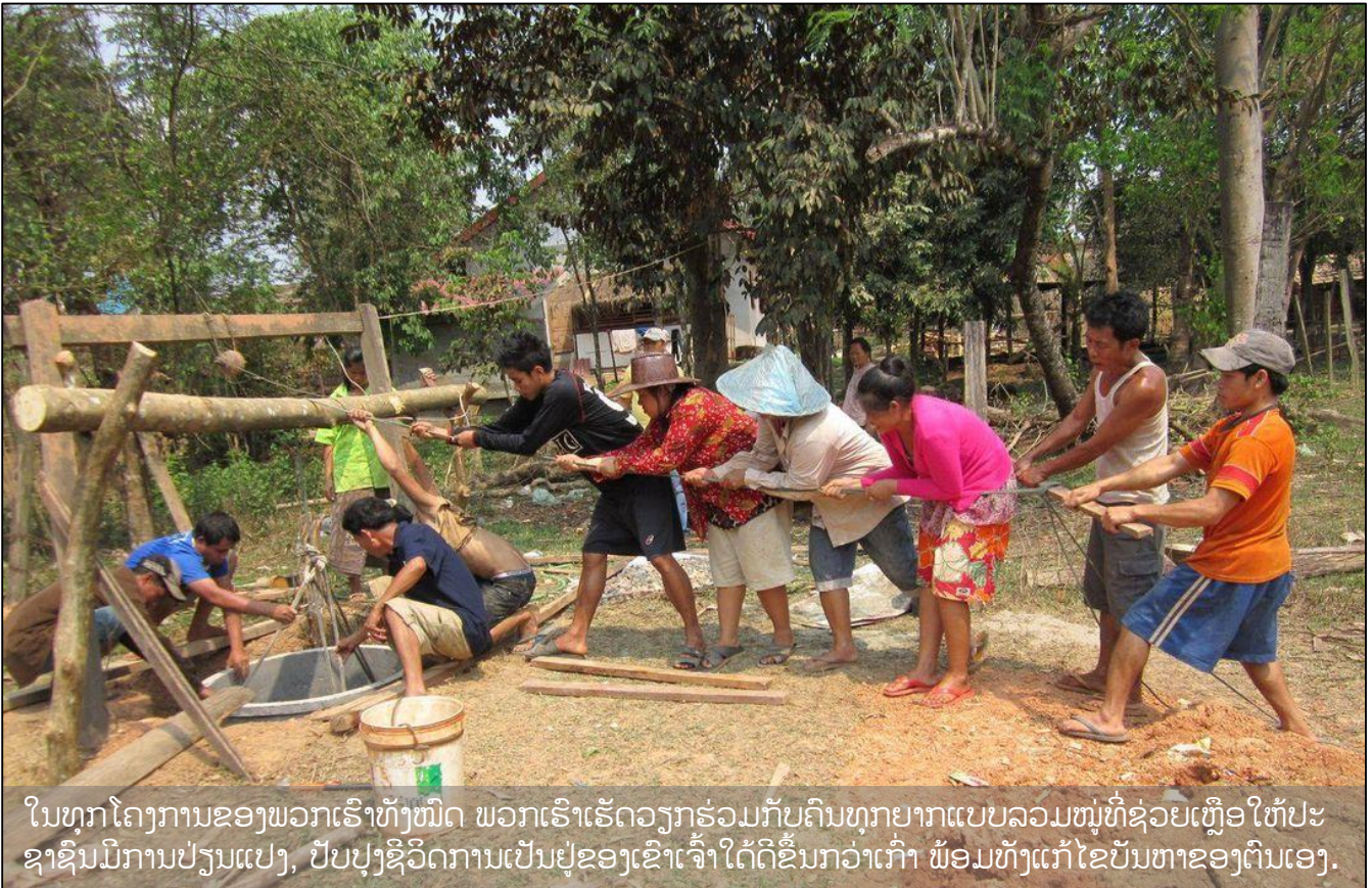
ໃນທຸກໂຄງການຂອງພວກເຮົາທັງໝົດ ພວກເຮົາເຮັດວຽກຮ່ວມກັບຄົນທຸກຍາກແບບລວມໝູ່ທີ່ຊ່ວຍເຫຼືອໃຫ້ປະຊາຊົນມີການປ່ຽນແປງ, ປັບປຸງຊີວິດການເປັນຢູ່ຂອງເຂົາເຈົ້າໃດ້ດີຂຶ້ນກວ່າເກົ່າ ພ້ອມທັງແກ້ໄຂບັນຫາຂອງຕົນເອງ.