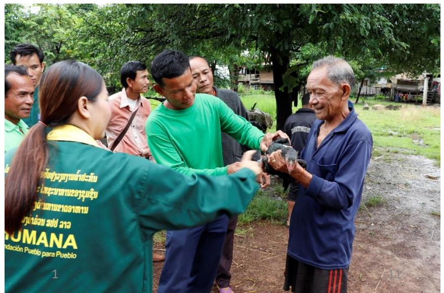
ຢູ່ໃນທັງໝົດ 100 ບ້ານ, ພະນັກງານສັດ ຕະວະແພດບ້ານໜຶ່ງຄົນໄດ້ຮັບການຝຶກອົບ ຮົມ ແລະ ອຸປະກອນຮັບໃຊ້ເພື່ອໃຫ້ເຂົາ ເຈົ້າສາມາດຊ່ວຍເຫຼືອຊາວກະສິກອນປະສົບ ຜົນສໍາເລັດໃນການລ້ຽງສັດ ແລະ ເພາະພັນ ທີ່ໄດ້ຮັບຈາກໂຄງການ.