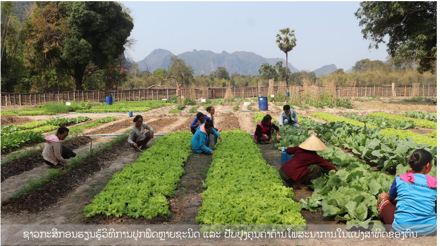
ຊາວກະສິກອນຮຽນຮູ້ວິທີການປູກພືດຫຼາຍຊະນິດ ແລະ ປັບປຸງຄຸນຄ່າດ້ານໂພສະນາການໃນແປງສາທິດຂອງຕົນ