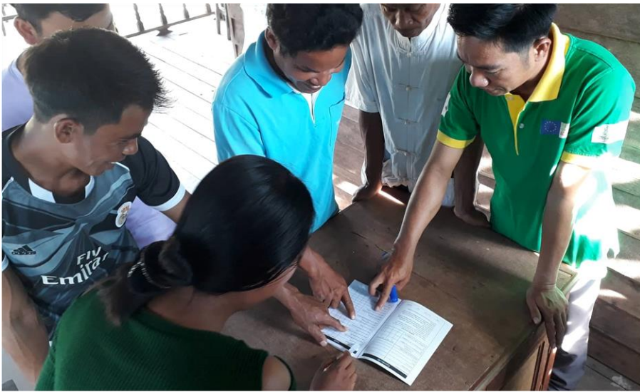
ຊາວກະສິກອນທຸກຄົນມີປຶ້ມສະມາຊິກ ທີ່ມີການຂຽນແຜນວ່າຈະເຮັດຫຍັງໃນ ແຕ່ລະປີ ແລະ ບັນທຶກຜົນໄດ້ຮັບ. ຊາວກະສິກອນແຕ່ລະຄົນຈະແລກປ່ຽນ ຜົນໄດ້ຮັບຂອງຕົນເອງ ແລະ ປຶກສາຫາ ລືກ່ຽວກັບກັບອຸປະສັກຂອງຕົນເອງໃຫ້ ສະມາຊິກຄົນອື່ນຢູ່ໃນກຸ່ມຮັບຮູ້ນຳ