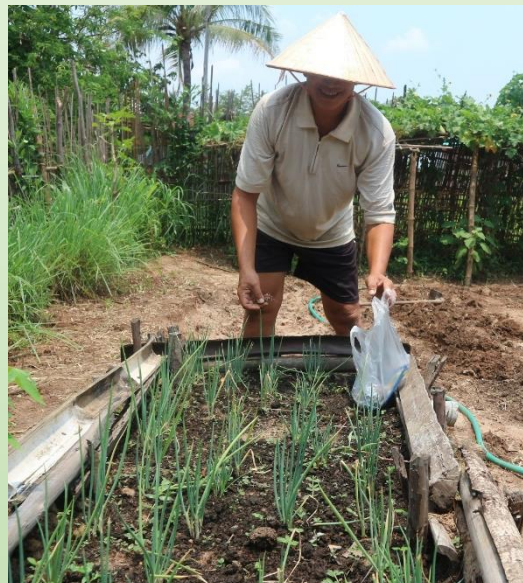
ພວກເຮົາສຸກຢູ່ໃຫ້ຄົນເປັນໂລກເອດປຸກຜັກ ແລະ ລ້ຽງສັດເພື່ອພື້ນຟູລະບົບພູມຄຸ້ມກັນຂອງຕົນເອງ ຊຶ່ງກໍໄດ້ຜົນດີ.

ມາຮອດປະຈຸບັນນີ້ສາມາດເຂົ້າເຖິງ 158 ຄົນໃນຈຳນວນ 200 ຄົນທີ່ເປັນໂລກເອດ ໃນນັ້ນຈຳນວນ 137 ຄົນກຳລັງໄດ້ກິນຢາຢ່າງຕໍ່ເນື່ອງ, 46 ກຸ່ມຕິດຕາມຄົນປ່ວຍໄດ້ຖືກສ້າງຕັ້ງຂຶ້ນ ແລະ ຈຳນວນ 100 ຄອບຄົວໄດ້ຮັບແນວພັນຜັກ ແລະ ສັດລ້ຽງສຳລັບສວນຄົວຂອງເຂົາເຈົ້າ. ບໍລິສັດ ວິທະຍາສາດການຢາຂອງປະເທດສະຫະລັດອາເມລິກາ Gilead Sciences ເປັນຜູ້ໃຫ້ທຶນສະໜັບສະໜູນໂຄງການດັ່ງກ່າວ.