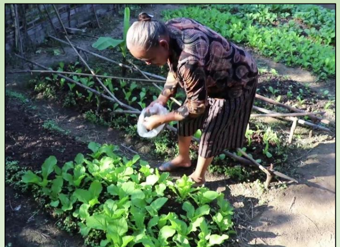
ຖ່ານແກບແມ່ນຜົນຜະລິດຂອງການເຜົາໃໝ່ທີ່ບໍ່ເປັນຂີ້ເຖົ້າ ມັນຈະຊ່ວຍປຸຍມັກ ແລະ ຝຸ່ນຄອກມີປະສິດທິພາບຫຼາຍຂຶ້ນ.

ໂຄງການດັ່ງກ່າວໄດ້ຮັບການຕອບຮັບເປັນຢ່າງດີຈາກຫຼາຍຄອບຄົວ. ເຂົາເຈົ້າໄດ້ມີສ່ວນຮ່ວມຢ່າງທ້າວຫັນເພື່ອຮັບເອົາປະໂຫຍດໃຫ້ຫຼາຍຈາກໂຄງການເທົ່າທີ່ຈະເປັນໄປໄດ້ ແລະ ເຮັດໃຫ້ເຮືອນຄົວບໍ່ມີຂວັນໄຟ ແລະ ນຳໃຊ້ແກບແທນການນຳໃຊ້ໄມ້ພືນ ແລະ ຖ່ານ.