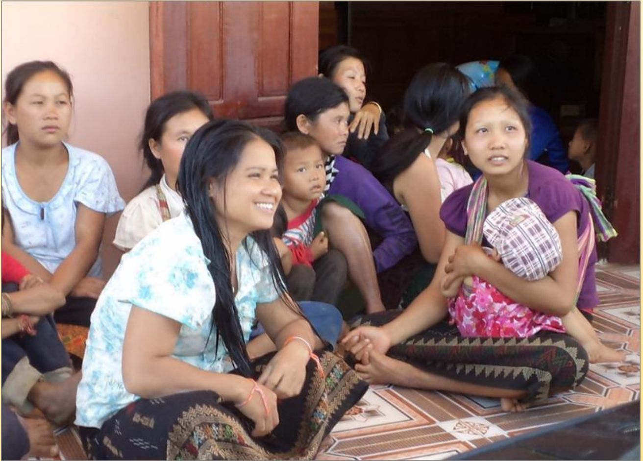
ຜ່ານໂຄງການຊ່ວຍເຫຼືອເດັກ ພວກເຮົາມີປະສົບການທີ່ຊີ້ບອກໄດ້ວ່າແມ່ຍິງຈຳນວນ 80% ເລີ່ມຕົ້ນນຳໃຊ້ການບໍລິການຂອງສຸສາລາ/ໂຮງໝໍນ້ອຍ ຕະຫຼອດໄລຍະການຖືພາມານ ແລະ ຫຼັງຈາກເກີດລູກ.